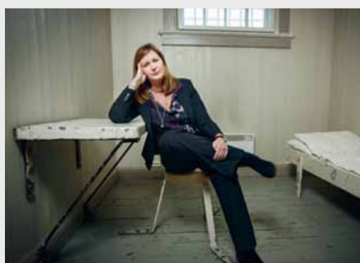
Ut av ROBEK etter mange år SIDE 4-5