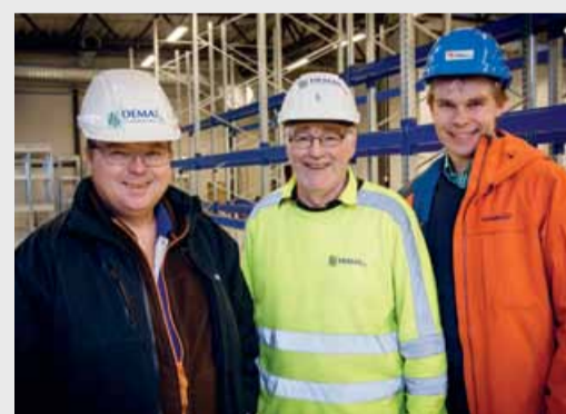
Bygger på Eggemoen SIDE 11