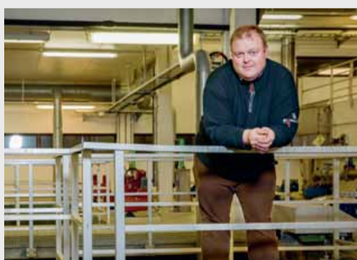
Utvider rensanlegget SIDE 9